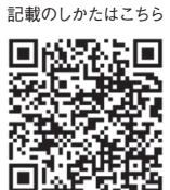
記載のしかたはこちら

◎この申告書は、あなたの給与について扶養控除、障害者控除などの控除を受けるために提出するもので、2か所以上から給与の支払を受けている場合には、そのうちの1か所にしか提出することができません。 ◎この申告書は、源泉控除対象配偶者、障害者に該当する同一生計配偶者及び扶養親族に該当する人がいない人も提出する必要があります。 ◎この申告書の記載に当たっては、裏面の「1 申告についてのご注意」等を お読みください。